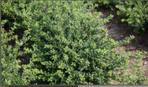
Ilex crenata Convexa