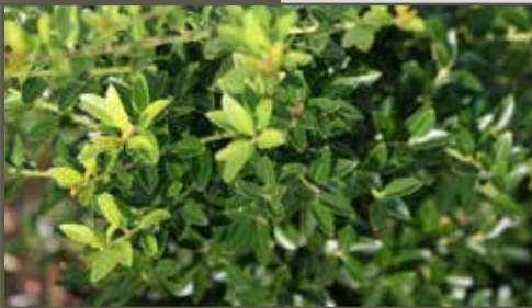
Ilex crenata Blondie