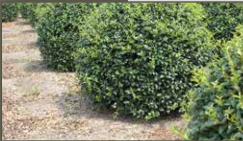
Osmanthus burwoodii bol