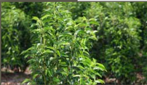
Prunus lusitanica Angustifloia