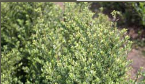
Ilex crenata Dark Green