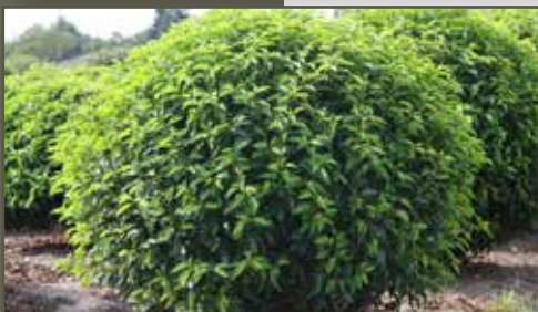
Prunus lusitanica Angustifloia bol