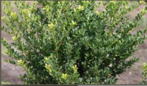
Ilex crenata Green Hedge