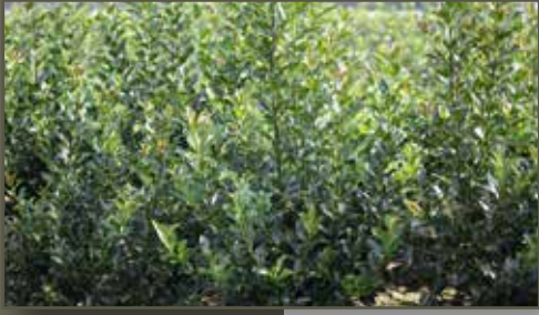
Ilex meserveae Blue Maid