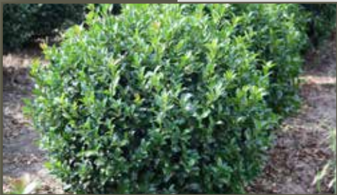
Ilex aquifolium Alaska