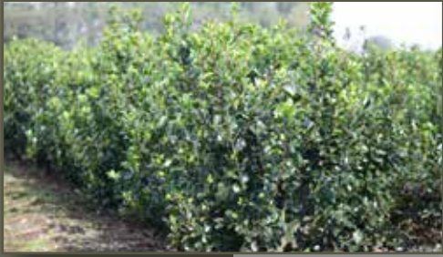
Ilex meserveae Blue Prince