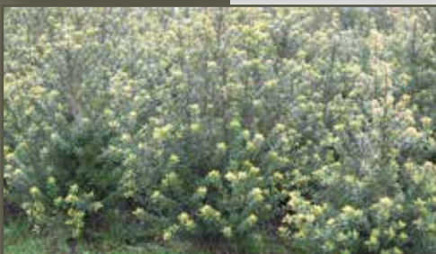
Ilex maximo Kanehirae